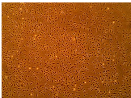
CSACBRI181 ヒト網膜毛細血管内皮細胞(RE)