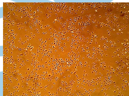
CSACBRI128 ヒト腎系球体毛細血管内皮細胞 (GE)

Cell Systems社製品は検索サイト 「 saibou.jp 」にてご確認下さい。 対象製品はメーカー略号が「CEL」で Cat.Noが「CS」で始まるになります。